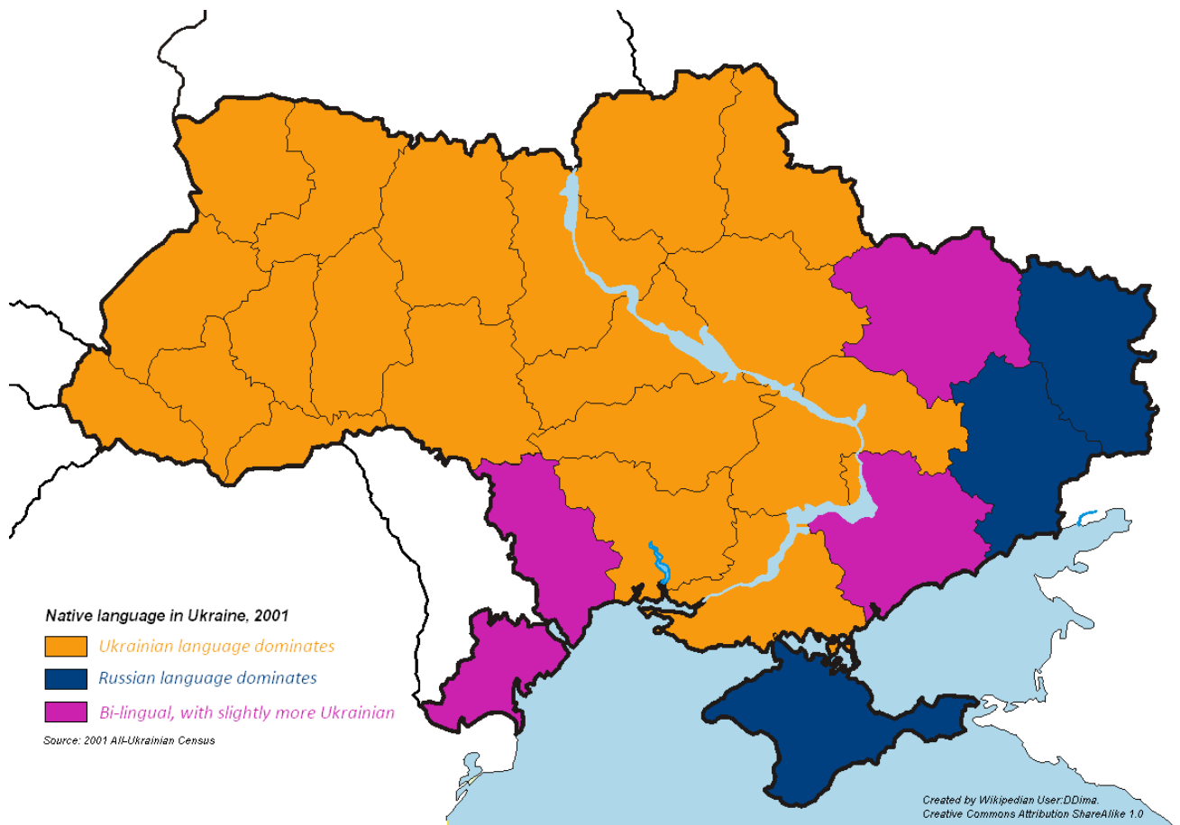
Карта розподілу населення за рідними мовами в Україні, 2001. Автор: Дмитро Сергієнко